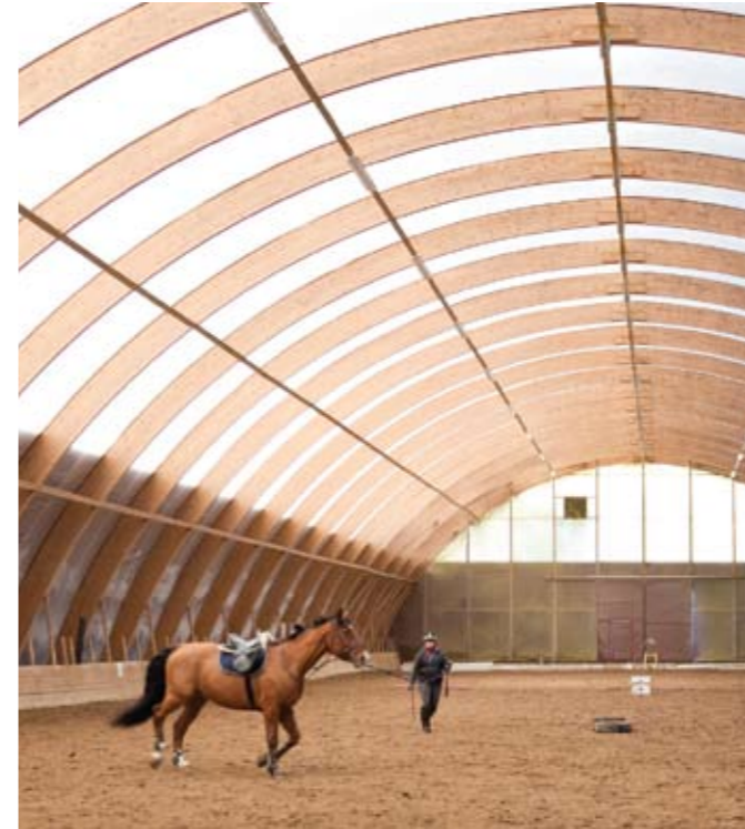
Suurpyölin tallilla on vuonna 2006 rakennettu maneesi, jossa kelpaa ratsastaa talvisaikaan.