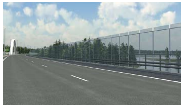
Ahvenkoski lännestä itään