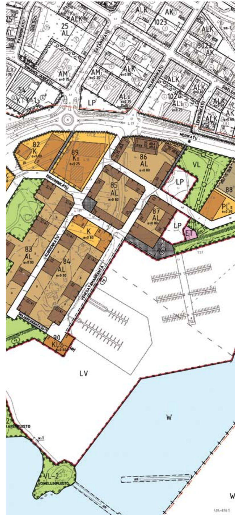
Haminan Tervasaaressa on vireillä asemakaavan muutos. Kuvan suunnitelma on vielä työn alla.