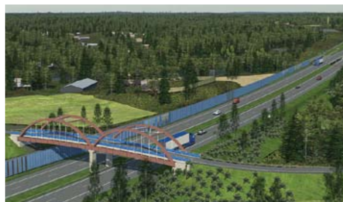
Pyhtään kirkonkylä lounas-etelä suunnasta